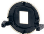
Visiering mit Bleiblende 2x3 Anterior Aiming ring with lead window 2x3 anterior 1 St./pc. Order No. 2130100038

Visieringe mit Bleiblende und Fenster: wischdesinfizierbar (optional erhältlich) Aiming rings with lead window: wipe disinfectable (optional available)