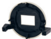
Visiering m. Bleiblende Posterior Aiming ring with lead window posterior 1 St./pc. Order No. 2130-981-26