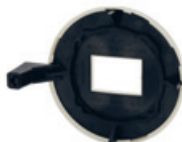
Visiering m. Bleiblende Bissflügel Aiming ring with lead window bitewing 1 St./pc. Order No. 2130-981-24