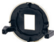
Visiering mit Bleiblende 2x3 Endo Aiming ring with lead window 2x3 endo 1 St./pc. Order No. 2130100038